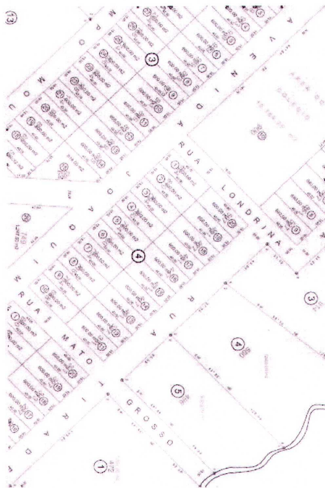
Figura 1: Quadra 'E', lote 05, Pontinha do Cocho